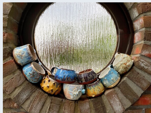
Eine Tasse herstellen und gestalten - Keramik

Faszientraining ist eine spezielle Form des